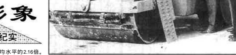
公路建设“二次战役”

常言道,火车跑得快全靠车头带。只有过硬的领导班子,才能培养造就一支高素质的能打硬仗的职工队伍。近年来,广饶县交通局始终把内强素质、外树形象作为加强干部职工队伍建设的关键来抓。本着“管人先管人,管人先育本”的原则,一级抓一级,层层抓落实。身教重于言教,在班子建设方面,局领导以身作则,严于律己,率先垂范,自觉做到“四个带头”,即带头学习,带头廉洁自律,带头勤政实干,带头讲文明。尤其是在公路建设、客运治理等攻坚工作中,局领导身先士卒,迎难而上,屡创佳绩。为了加强对班子和干部职工队伍的思想教育,该局