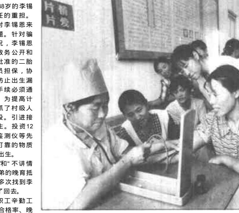
广饶县陈官乡计生办定期为育龄妇女进行健康体检,发现问题及时采取措施。